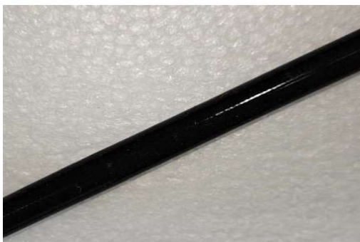
エイシンインターナショナル FRS-4U